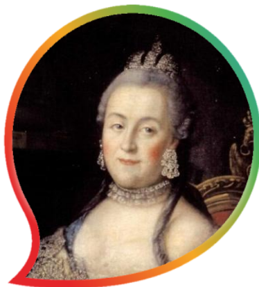
Портрет Екатерины II (Антропов А. П. 1766 г.)