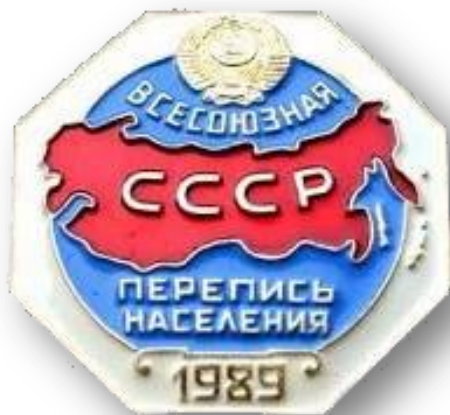
Знак переписи населения